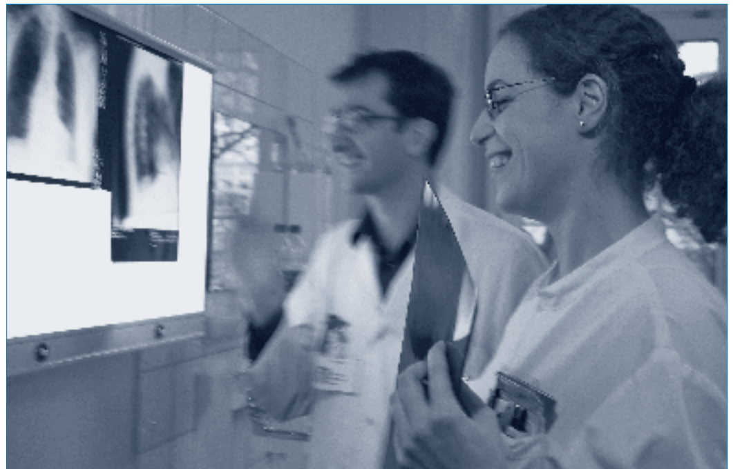
A l'avenir, les femmes médecins seront au premier plan.