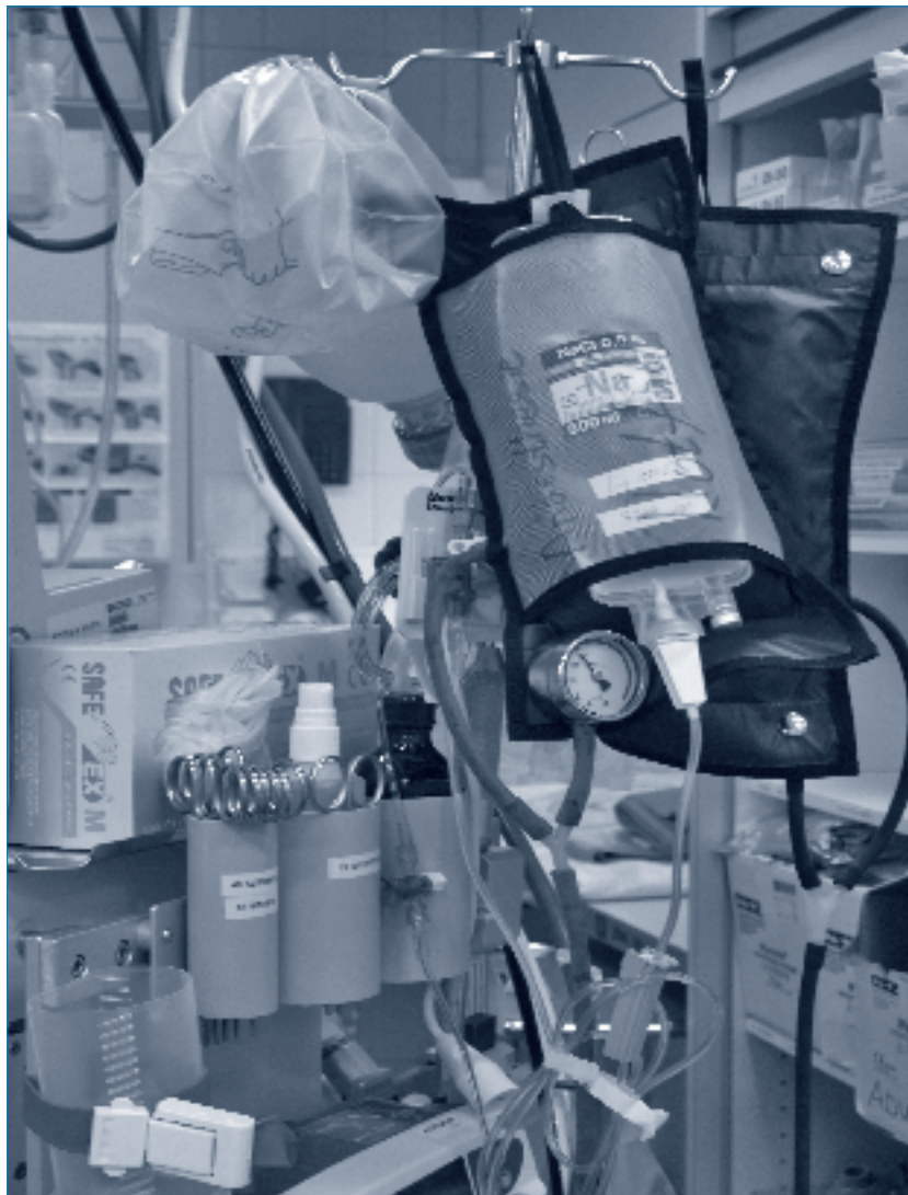
Où s'arrêtent les traitements en fin de vie?

Finalement, les directives abordent aussi les cas où l'équipe soignante ou les proches doutent que les directives anticipées correspondent toujours à la volonté présumée du patient. Elles stipulent dans quelles situations il convient