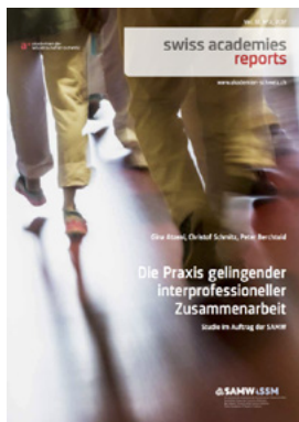
La pratique d'une collaboration interprofessionnelle réussie (en allemand avec résumé en français)