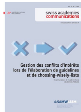
Gestion des conflits d'intérêts lors de l'élaboration de guidelines et de choosing-wisely-lists