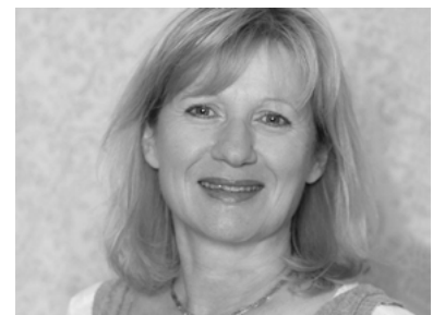
Dominique Nickel Traduction