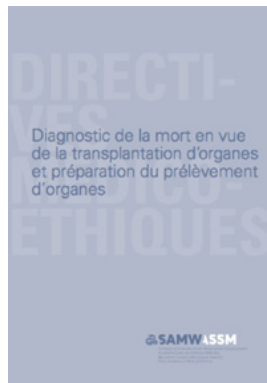
Diagnostic de la mort en vue de la transplantation d'organes et préparation du prélèvement d'organes