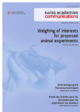
Pesée des intérêts dans les demandes pour les expériences sur animaux – Guide destiné aux requérants